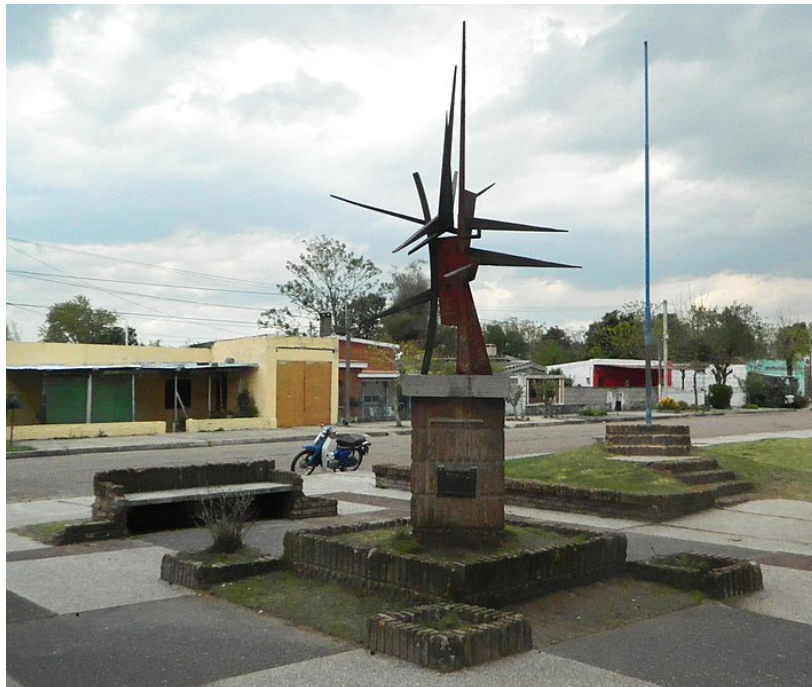
Escultura de Octavio Podestá (Plaza Levratto). Ubicada en el departamento de Río Negro

A modo de ejemplo, si la propuesta se fuera a desarrollar en la ciudad de Fray Bentos, podría usarse la obra ubicada en la plaza Levratto de dicha localidad.