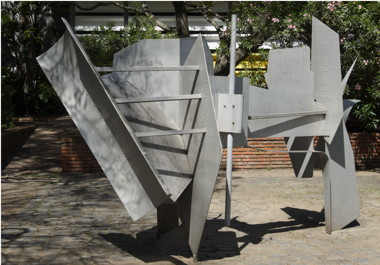
Podestá, Octavio "Overlock", 1991. Museo Nacional de Artes Visuales, Montevideo, Uruguay.

Descripción: La presente propuesta didáctica busca diferenciar dos técnicas escultóricas, a partir del análisis y el conocimiento de la obra de dos artistas uruguayos contemporáneos: Octavio Podestá y Pablo Atchugarry.