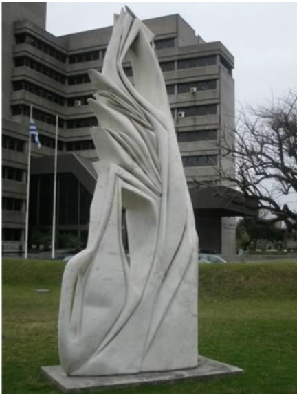
Atchugarry, P. "Semilla de la amistad", 1996