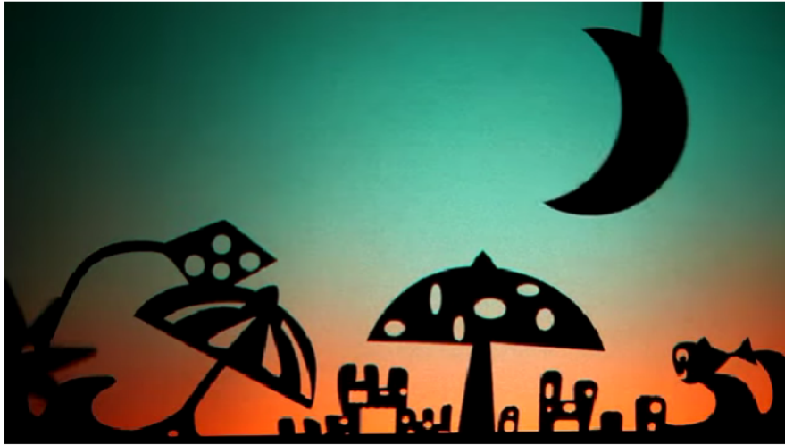
En el mar (teatro de sombras)

https://www.youtube.com/watch?v=ZxXSv6arpGk