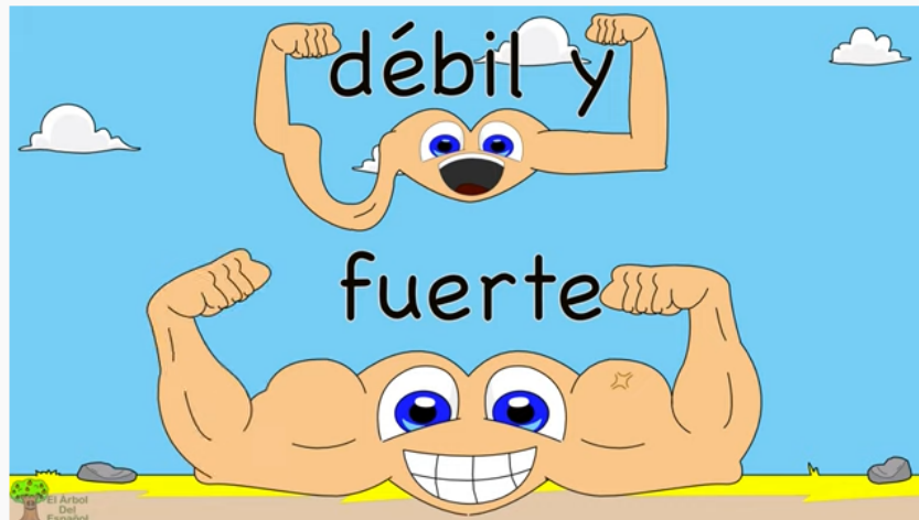
La Canción De Los Opuestos | Rima Infantil

Otra forma de reforzar el concepto es a través de la canción. En este video se presenta una gran variedad de antónimos.