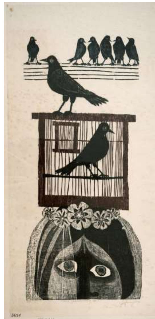
Novia revolucionaria XI