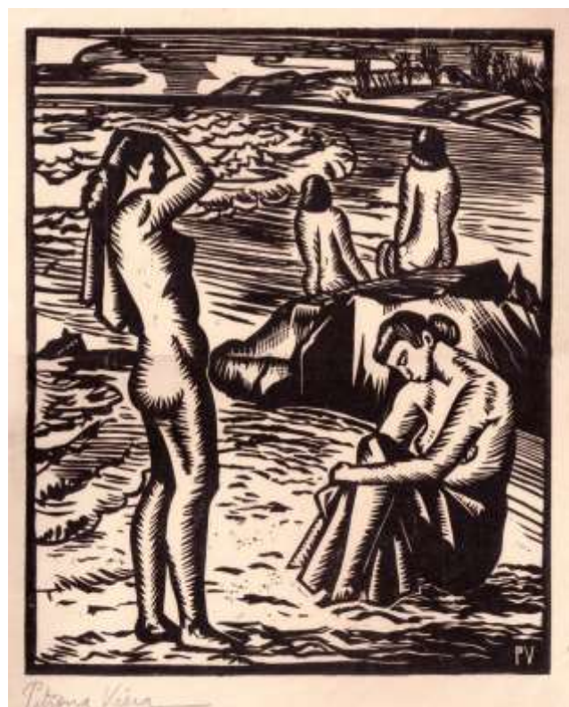
Desnudo, roca y mar