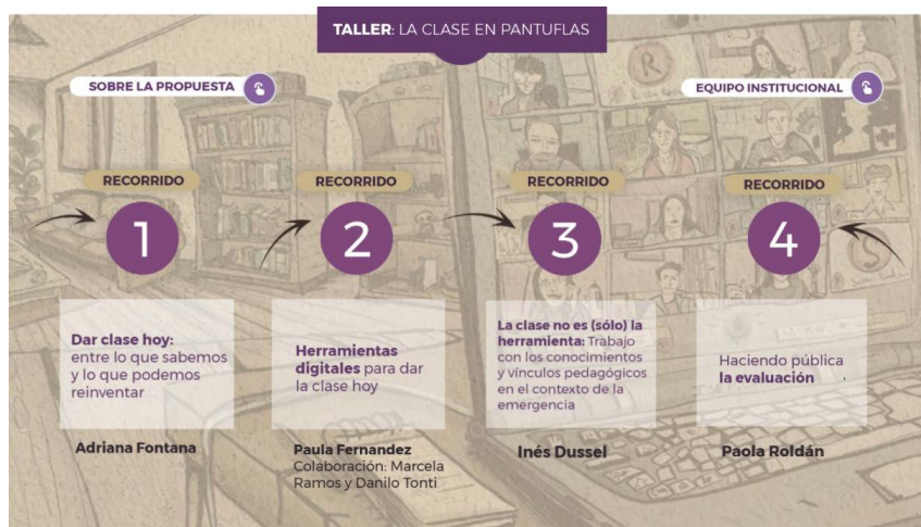
Figura 1. Imagen de una vista general del taller virtual «La clase en pantuflas».

Más de quinientos cursantes lo comenzaron, y están terminando mientras escribo estas páginas. Dada la ocasión, jugamos con la metáfora de la casa y con los recorridos por diferentes lugares en los que invitamos a los colegas cursantes a leer, seguir estudiando, participar en una feria de herramientas digitales en la que «experimentar» Twitter, Facebook live; Padlet, Telegram, Instagram, entre otras; a ver lo que está pasando en las redes, etc. (Figura 1).