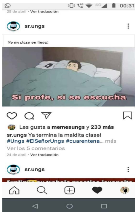
Figura 1. Meme elaborado por estudiantes de la UNGS.

Efectivamente, luego de una primera etapa de adaptación a la novedad, de entusiasmo por preservar el contacto, la relación, el vínculo –o, mejor dicho, por sostener una conversación, tal como planteó Inés Dussel (2020) en un webinar organizado por el Instituto Superior de Estudios Pedagógicos de Córdoba que logró una enorme circulación; posiblemente porque brindó pistas y guías allí donde casi nadie sabía cómo moverse–, se percibe cierto cansancio y estancamiento en las dinámicas.