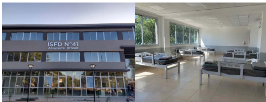
Figuras 2 y 3. ISFD N° 41 transformado en hospital de emergencia.

Adjuntamos dos fotos que, de algún modo, condensan la dramaticidad del momento que vivimos: son de un edificio que iba a inaugurarse el 30 de marzo para el ISFD N° 41, construido por el Municipio de Almirante Brown. Ante la emergencia sanitaria fue transformado en un hospital para alojar a pacientes con covid-19. Una imagen es del frente, la otra del espacio que estaba destinado a funcionar como aula.