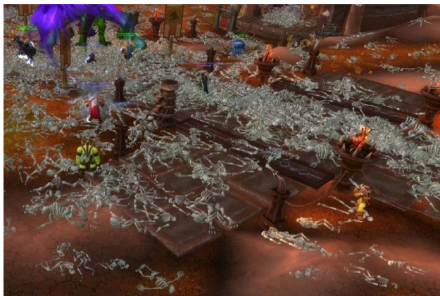
Figura 1. Captura de pantalla de World of Warcraft durante el episodio corrupted blood del año 2005.

Los cadáveres se amontonan en las plazas centrales de varios de los pueblos más importantes. Súbitamente, la salud de muchos empeora hasta la muerte sin alguna causa explicable. Luego de un tiempo, se comprende que las montañas de esqueleto son producto de un virus que empezó en las mazmorras y que se descontroló porque personajes no humanos, como mascotas, sirvieron como ruta de salida del virus fuera del entorno controlado de esas mazmorras. Rápidamente, el virus se propaga. Las autoridades emiten un comunicado donde decretan una cuarentena voluntaria para que las personas no visiten los pueblos y para que eviten desplazarse. Sin embargo, muchos curiosos se acercan para deleitarse con la escena de los cadáveres amontonados; algunos se infectan y pagan con su vida el precio de la curiosidad.