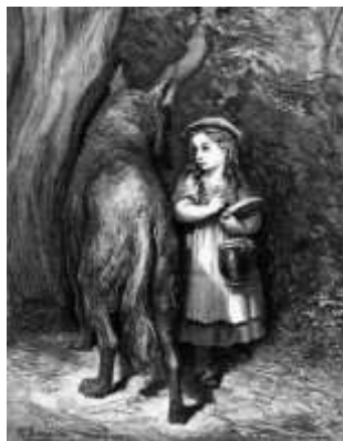
Dore ridinghood por Thuresson – DOMINIO PÚBLICO

Sin lugar a dudas la aparición de la imprenta generó un cambio trascendental en el campo de la ilustración pues surgen con ella, diversas técnicas de grabado como la xilografía, linografía y serigrafía.