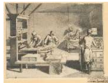
Chodowiecki Basedow Tafel 21 c Z por Quibik – DOMINIO PÚBLICO

El diseño se graba espejado y en negativo sobre la superficie de linóleo con un cuchillo afilado, gubia, o cincel en forma de V. La hoja de linóleo se entinta con un rodillo (llamado Brayer), y, a continuación, se imprime sobre papel o tela. La impresión puede hacerse a mano o con una prensa.