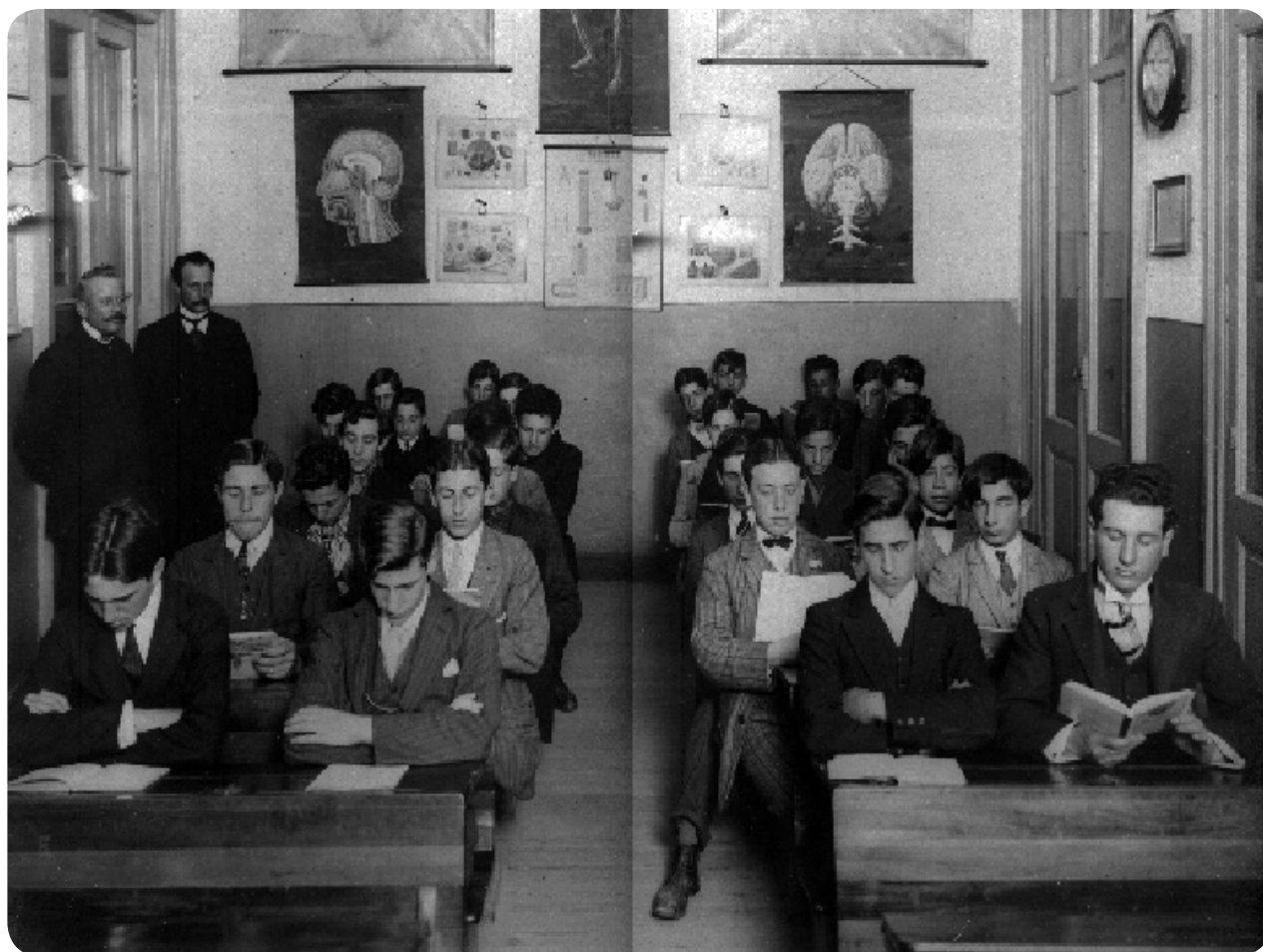
Curso Nocturno para Adultos del año 1912