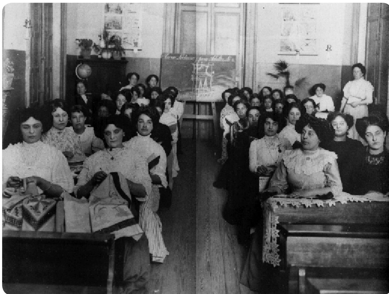
Curso Nocturno para Adultos del año 1912