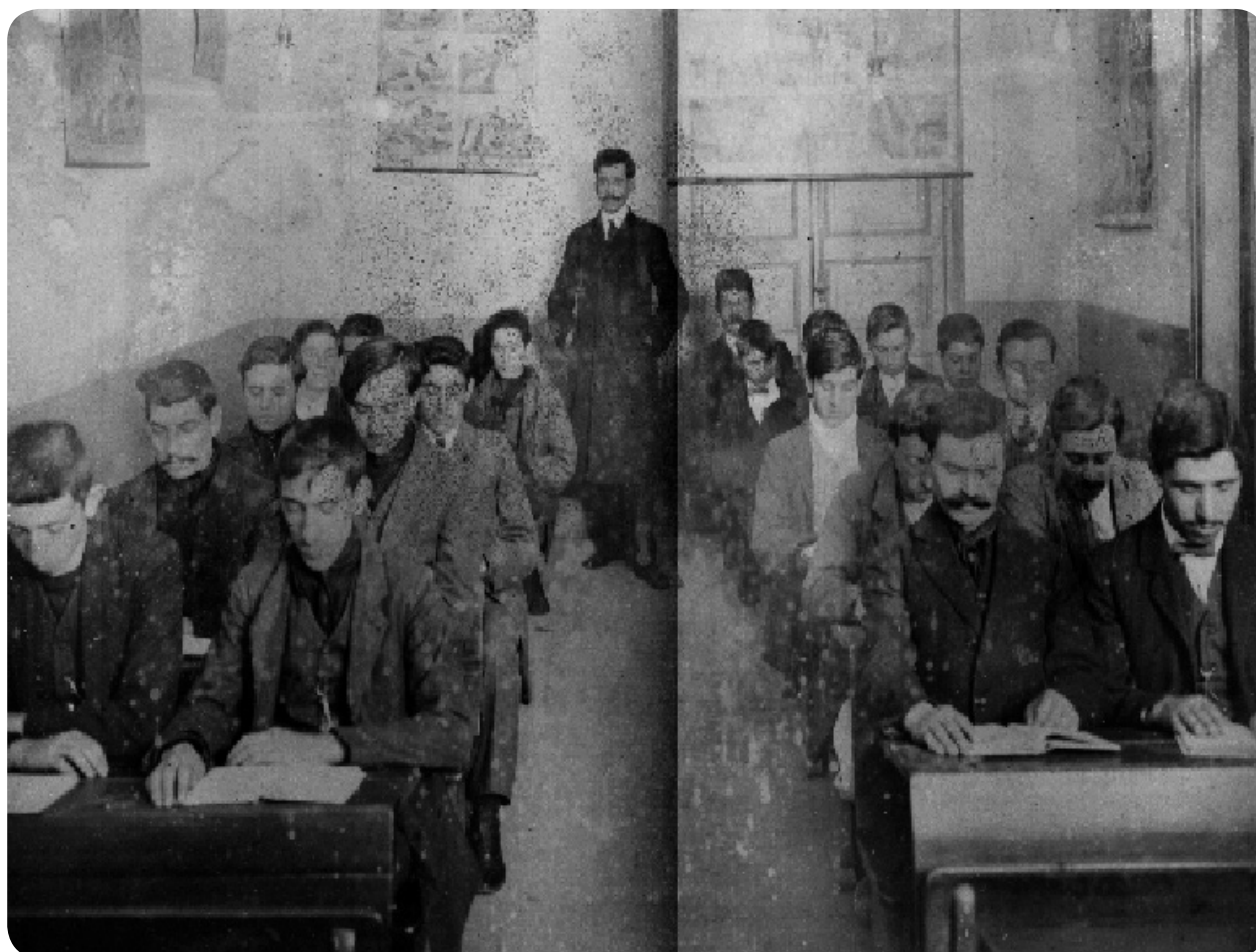
Curso Nocturno para Adultos del año 1912