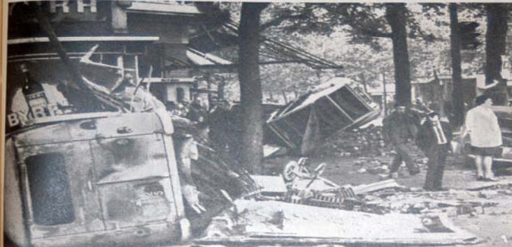
PARÍS, 24. Arriba, algunos de los daños ocasionados en la noche anterior durante los incidentes entre policías y estudiantes en la calle Edouard Belin. A la derecha, vista de los Campos Eliseos desiertos, hoy desierto, y consecuencia de las graves incidencias que vienen ocurriendo últimamente. Pese a los esfuerzos del Presidente Charles de Gaulle y a sus promesas, la situación que está viviendo Francia es alarmante. Aun no se logra evitar una posible solución y existe temor de que las protestas continúen y produzcan con mayor intensidad. (Inf. pag. 7)